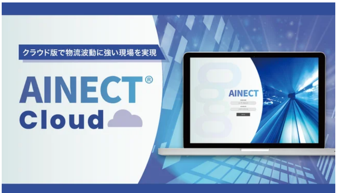
AINECT®ログイン画面イメージ

多様なマテリアルハンドリング機器とシームレスに連携し、あらゆる現場のニーズに応える最適解